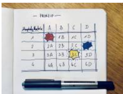
Abb. Prinzip der morphologischen Matrix.