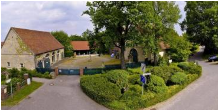
✘ Baumberger Sandsteinmuseum, Havixbeck

Im WiSe 2024/25 wird es eine Kollaboration mit dem Baumberger-Sandstein Museum in Havixbeck geben.