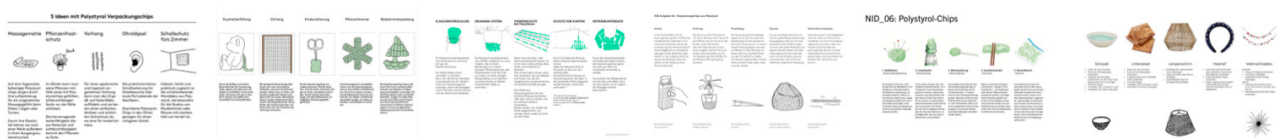
Beispiele aus vergangenen Semestern.

Ergänzen Sie Ihre Ansätze, wie im oberen Beispiel durch Ideenscribbles . Ein PDF der Top 5 Ansätze wird vor der nächsten Unterrichtseinheit im Mattermost Kanal der Klasse gepostet.