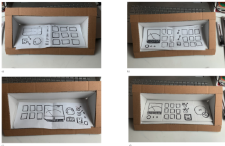
verschiedene Varianten für die Oberfläche, um mehr (X) für mehrkriterien angepasst