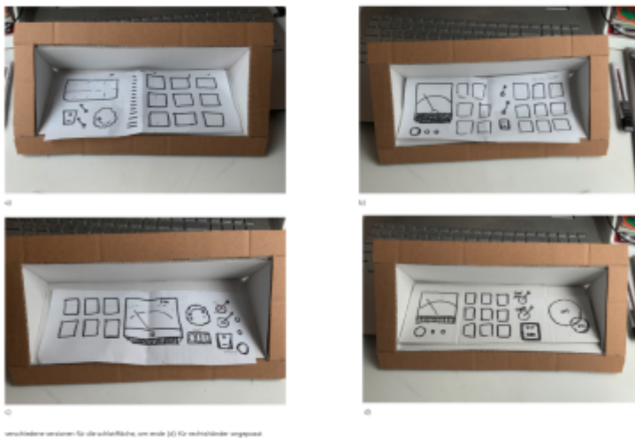
verschiedene Ansichten für die Oberfläche, um mehr (C) für rechtsläufige angepasst