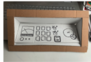
verschiedene Varianten für die Bedienfläche, um erste (G) für rechtshänder angepasst