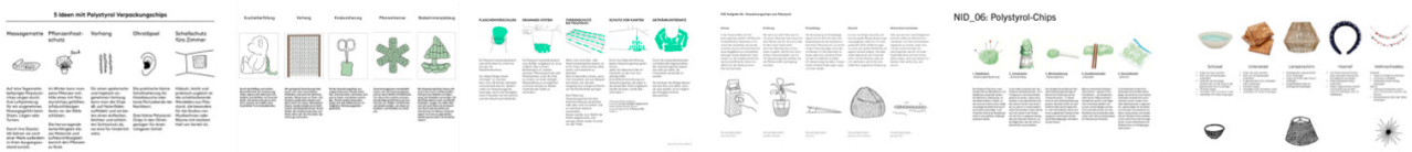
Beispiele aus vergangenen Semestern.

Ergänzen Sie Ihre Ansätze, wie im oberen Beispiel durch Ideenscribbles – also Handzeichnungen oder auch KI-Generierten Bildinhalten, die dabei helfen sollen den Kontext Ihres Ansatzes zu erklären.