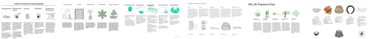
Beispiele aus vergangenen Semestern.

Ergänzen Sie Ihre Ansätze, wie im oberen Beispiel durch Ideenscribbles – also Handzeichnungen oder auch KI-Generierten Bildinhalten, die dabei helfen sollen den Kontext Ihres Ansatzes zu erklären.