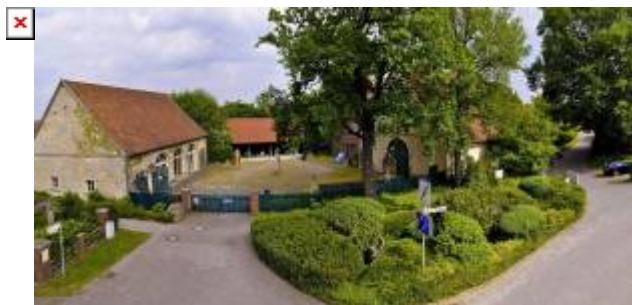
Baumberger Sandsteinmuseum, Havixbeck

Im WiSe 2024/25 wird es eine Kollaboration mit dem Baumberger Sandsteinmuseum in Havixbeck geben.